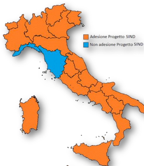
Figura IV.5.2: Adesione delle Regioni e PP.AA. al progetto SIND Support