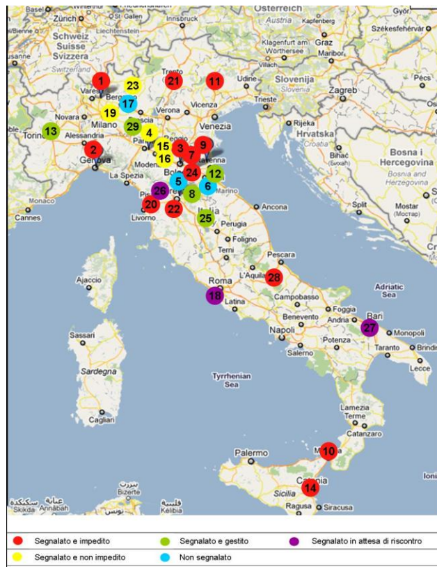
Figura IV.4.1: Mappatura dei rave segnalati dal Dipartimento Politiche Antidroga (28 ottobre – 26 maggio 2011) in ordine cronologico di individuazione.